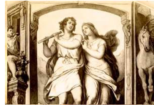
Pamina ou l'initiative Fondatrice. La Flûte enchantée - Mozart.