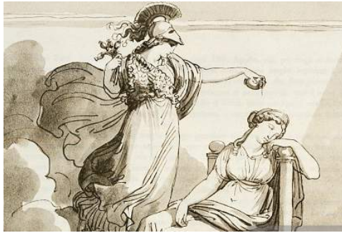
Pénélope ou l'exigence de Légitimité. Le Retour d'Ulysse - Monteverdi.