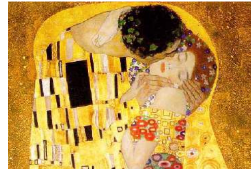
Ariane à Naxos au risque de la Métamorphose. Ariane à Naxos - R. Strauss.

Chacune de ces femmes incarne un parcours exemplaire de leadership. Fréquenter, éprouver, interroger ces trajectoires, c'est entrer en résonance avec des approches différenciées de l'autorité et de l'exercice des responsabilités.